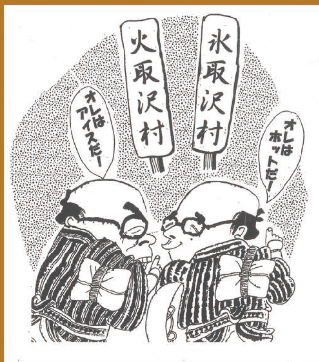
「氷取沢」はむかし「火取沢」だった！？