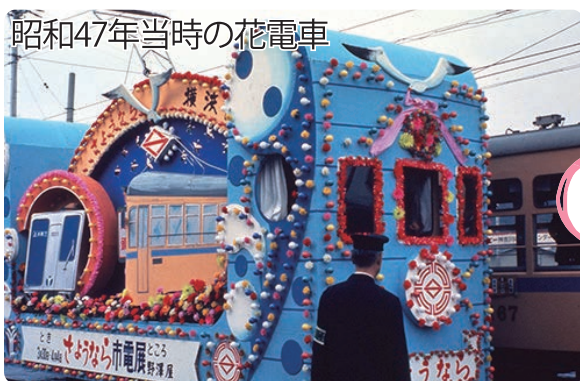
昭和47年当時の花電車