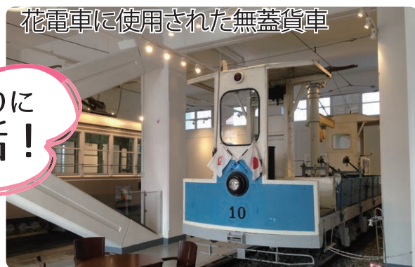
花電車に使用された無蓋貨車